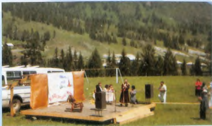
Каспада јайаандык туштажуда

Омок чычканак Јоголып калды. Андый кожондор Угулбас болды.