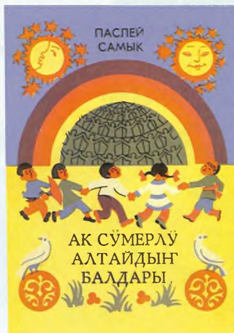
Балдарга учурлалган бичик