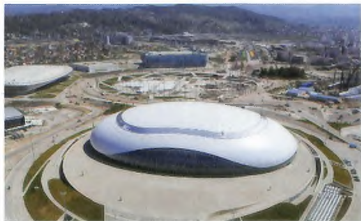
Јаан тош арена