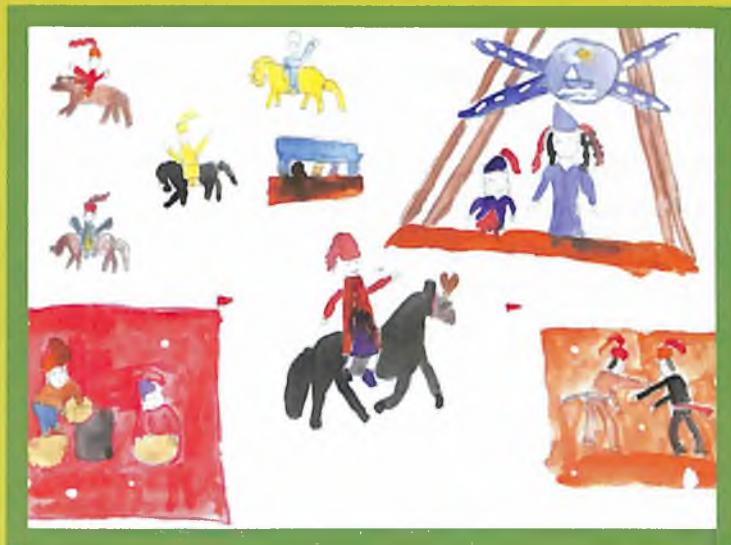
Кныева Настянын журугу, Мооты-Оозы журт