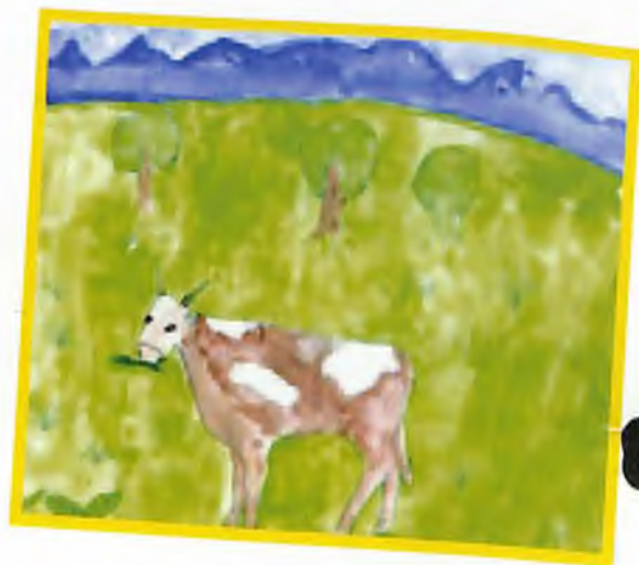
“Чокырагым” Трафимова Лара, 3 кл., Теленит-Сортогой јурт