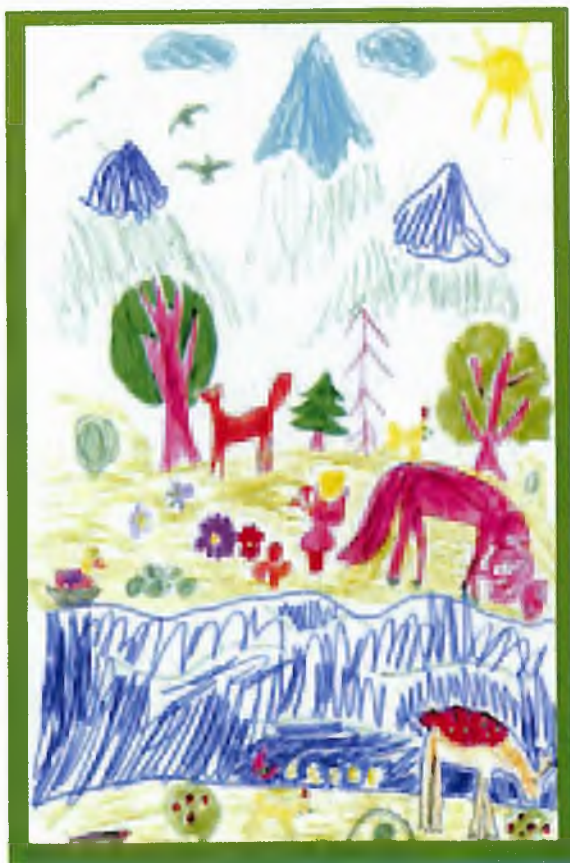
“Төрөл Алтайым” Бедюрова Карина, 2 кл., Түнүр журт