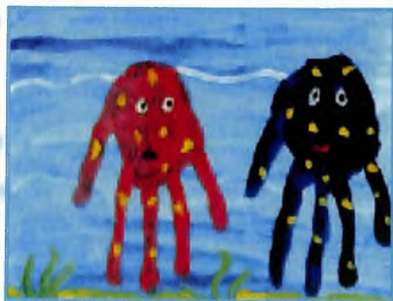
“Осьминогтор” Чекурашева Саяна, 4 кл.