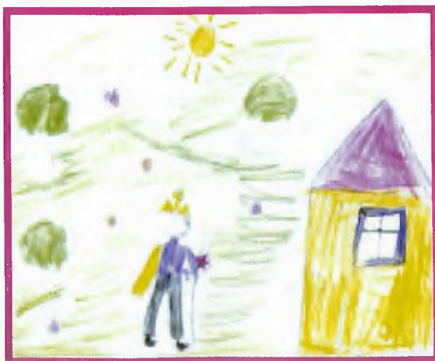
Якпунова Сусанна, 2 кл., Теленит-Сортогой