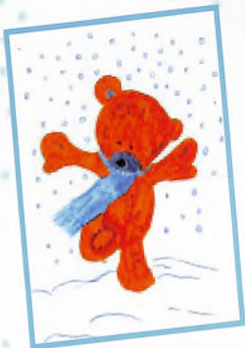
“Айучак” Сыева Сынару, Горно-Алтайск кала