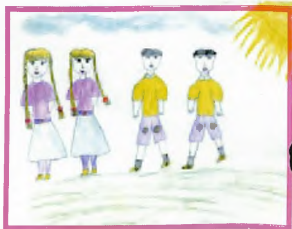
Кободокова Ижена, 2 кл., Кара-Кузур јурт