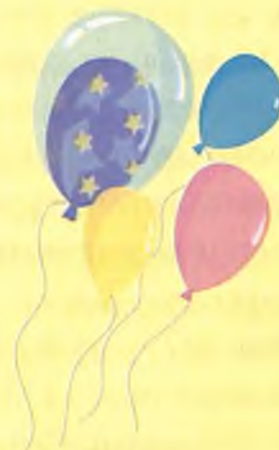
«Менин айлым». Станислав Енчигешевтин журугу, 9 жашту, Горно-Алтайск калананг