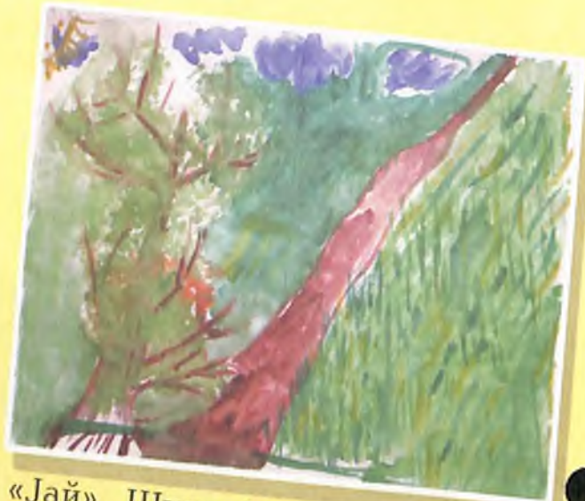
«Жай». Шуну Ютеевтин журугу, 8 жашту, Горно-Алтайск каланан