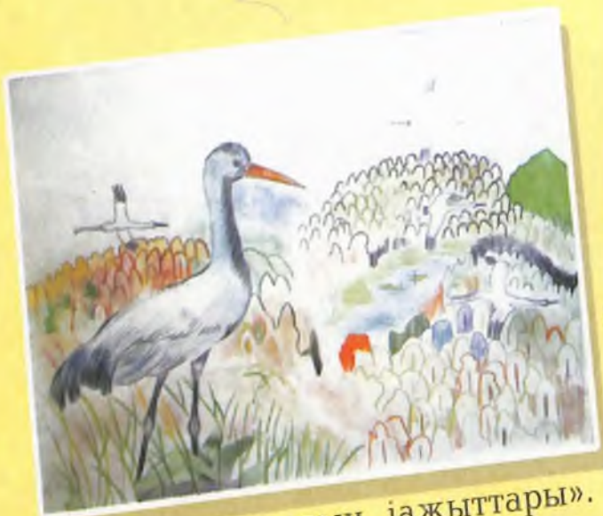
«Алтайымнын алтын жажыттары». Денис Овчинниковтын журугу, 13 жашту, Белый журттан