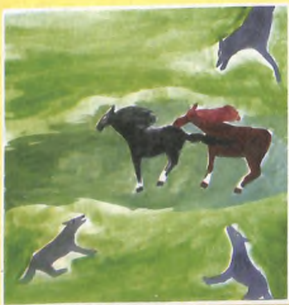
«Тартыжу». Быйанду Бадановтын журугу, Горно-Алтайск каланан