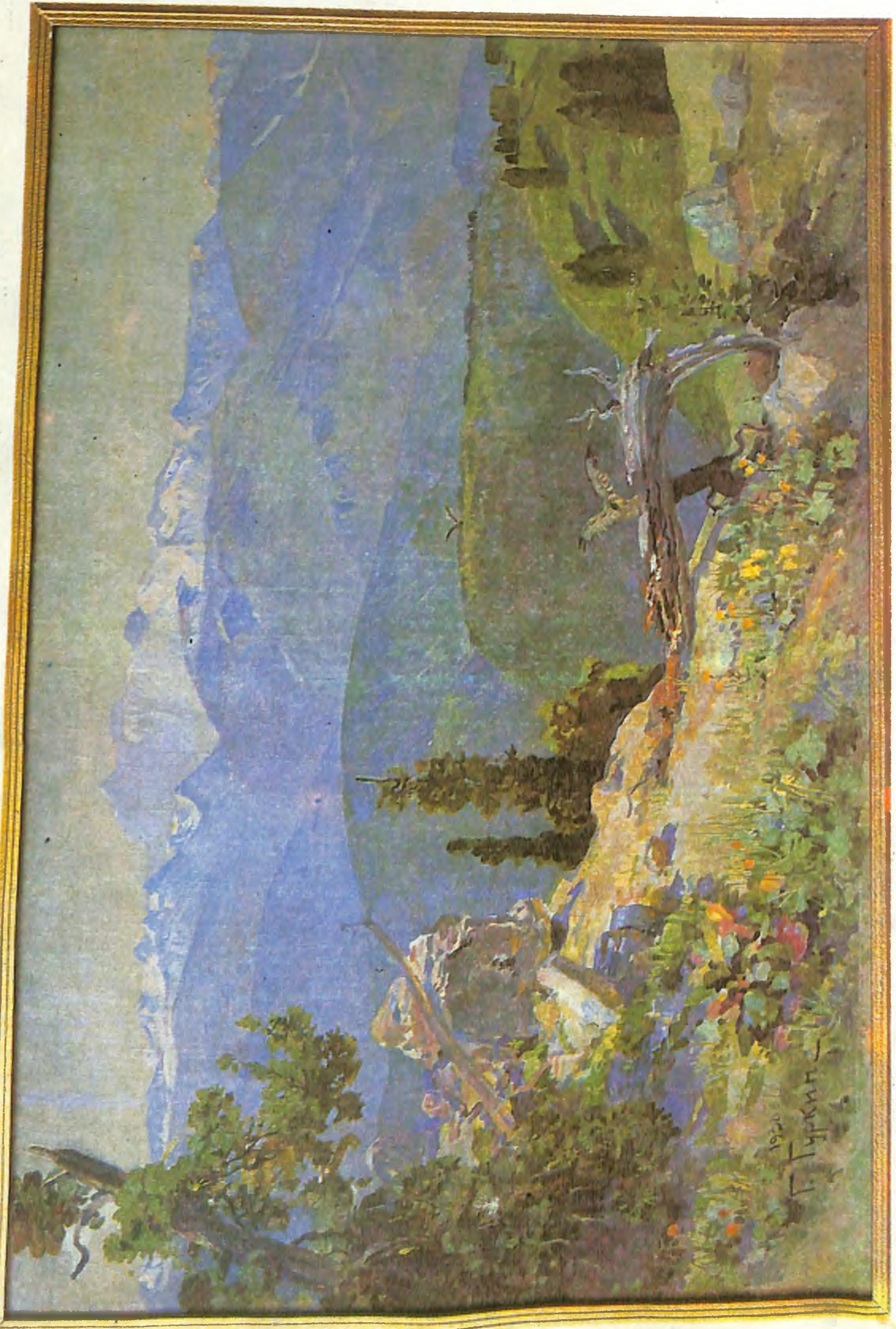
Г. И. Чорос-Гуркин «Мүркүтгер»