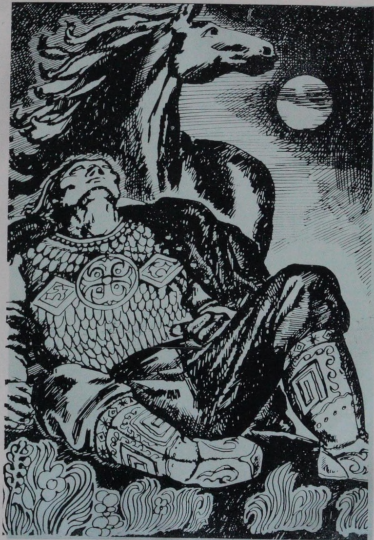
«Тоймон-Коо» деп чӧрчӧк аайынча журук