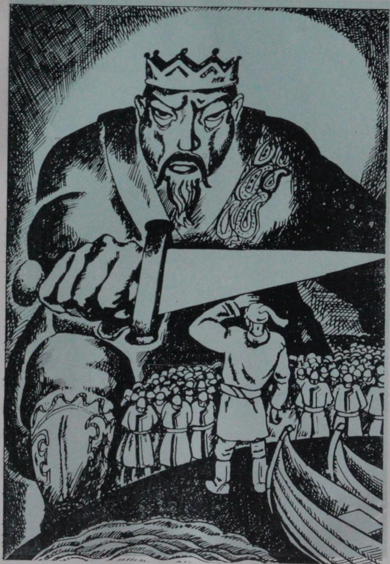
«Оскүс-Уул» деп чөрчөк аайынча журук