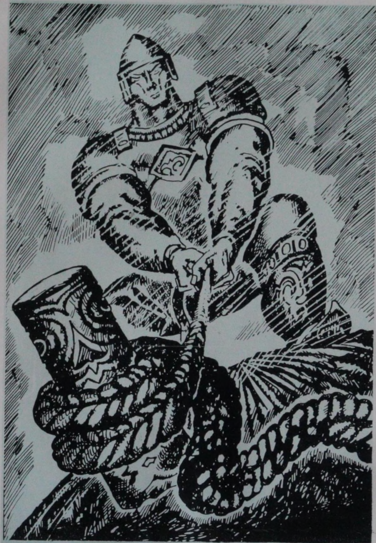
«Яланаш-Уул» деп чөрчөк айынча журук