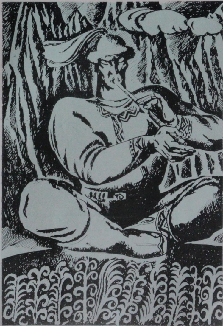
«Кан је рең атту Кан-Алтын» деп чөрчөк аайынча журук