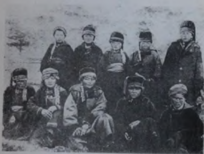
Кызыл Куладынине коммунар келиндери, 1930 жыл, жай.