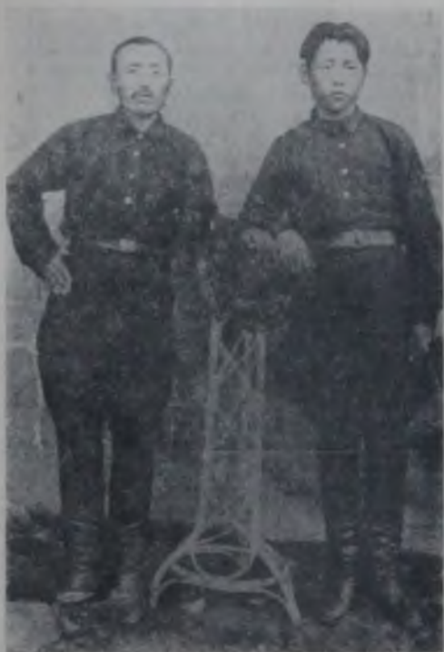
Тектий ле Чыйык Майчиковтор. Москва, 30-чы жылдар

дагам. «Локомобиль» деп тагмалу машина экелген. Төртөн аттын кучи. Ол келерде, планировка керек болгон. Мен баштап өткүрдим. Төнгөштөр канайда туруп баратанына бери.