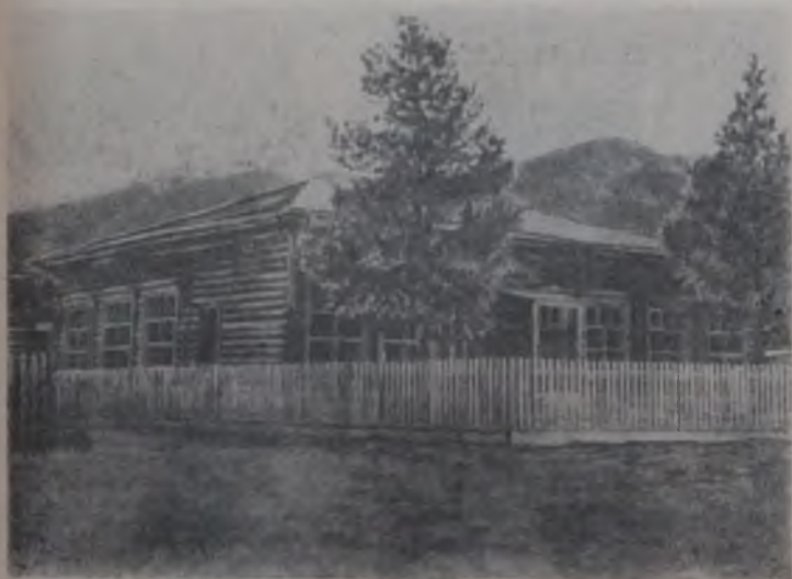
Жирменчи жылдарда тудулган школ