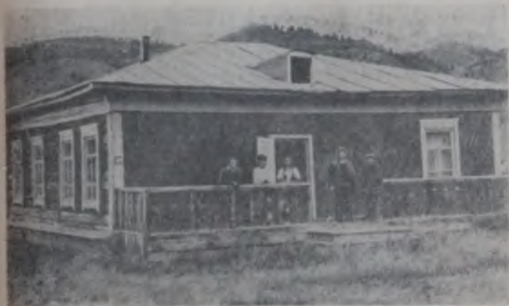
Лурт музей. 1926—1927 жылдар киреде балдардын яслизы болгон