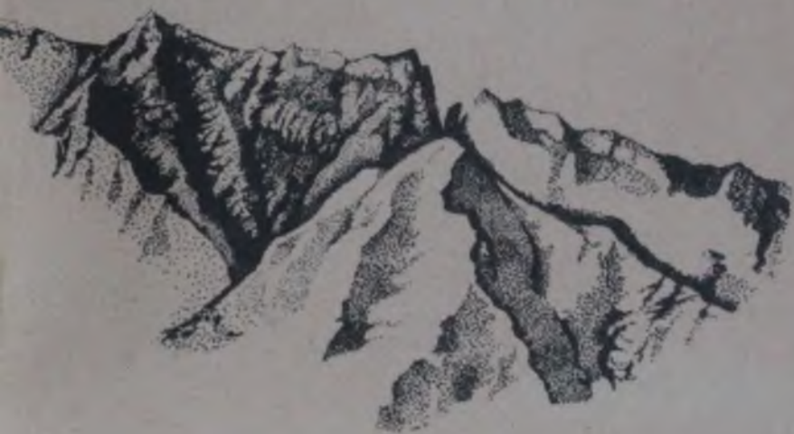
Б. Ередеев. Кайыр туулар.