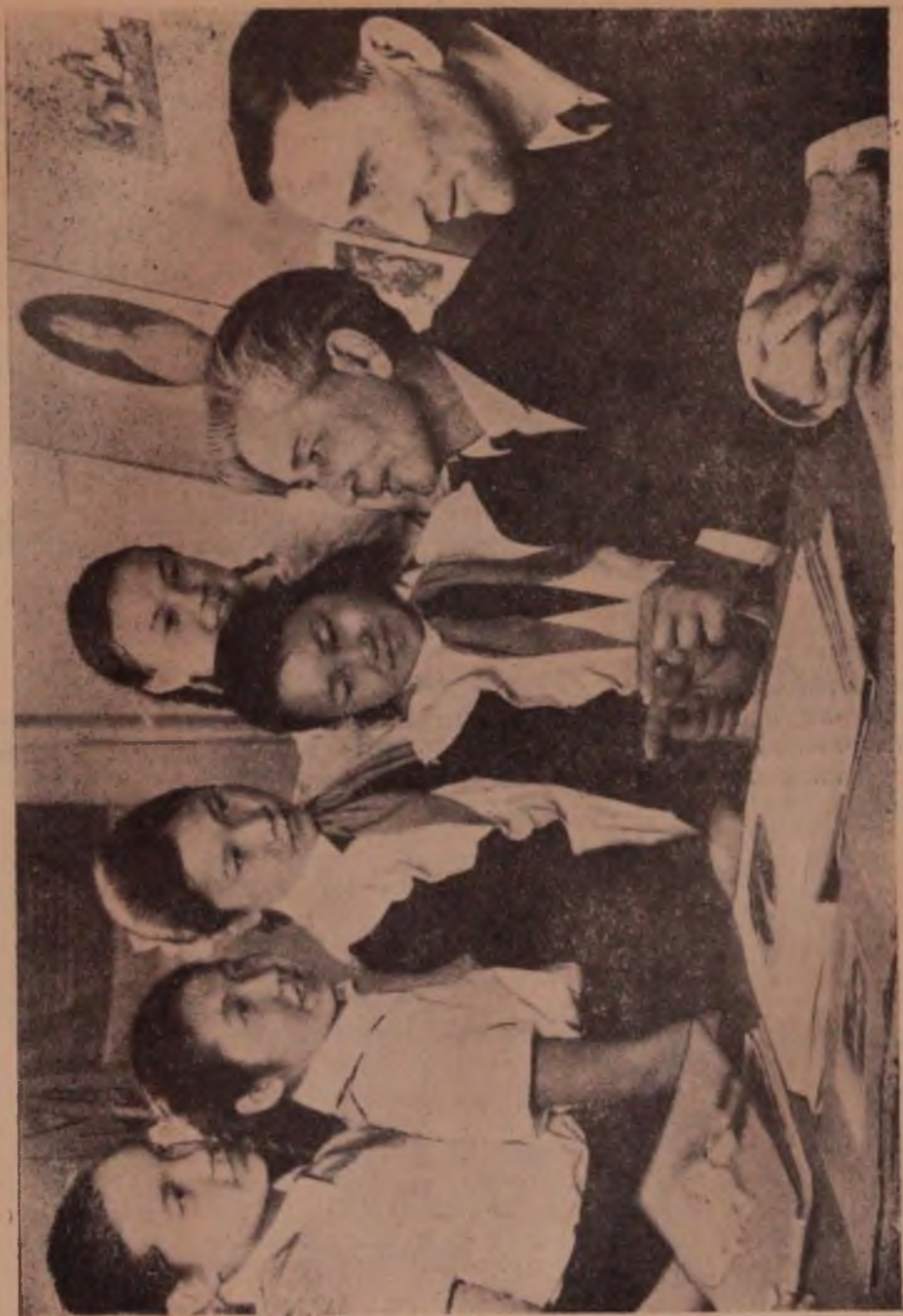
Писательдер ле балдар.