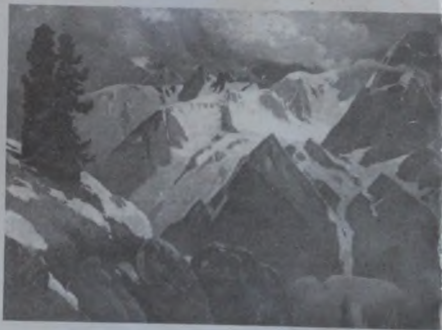
Гуркин Г. Хан Алтай Х., м., 1936