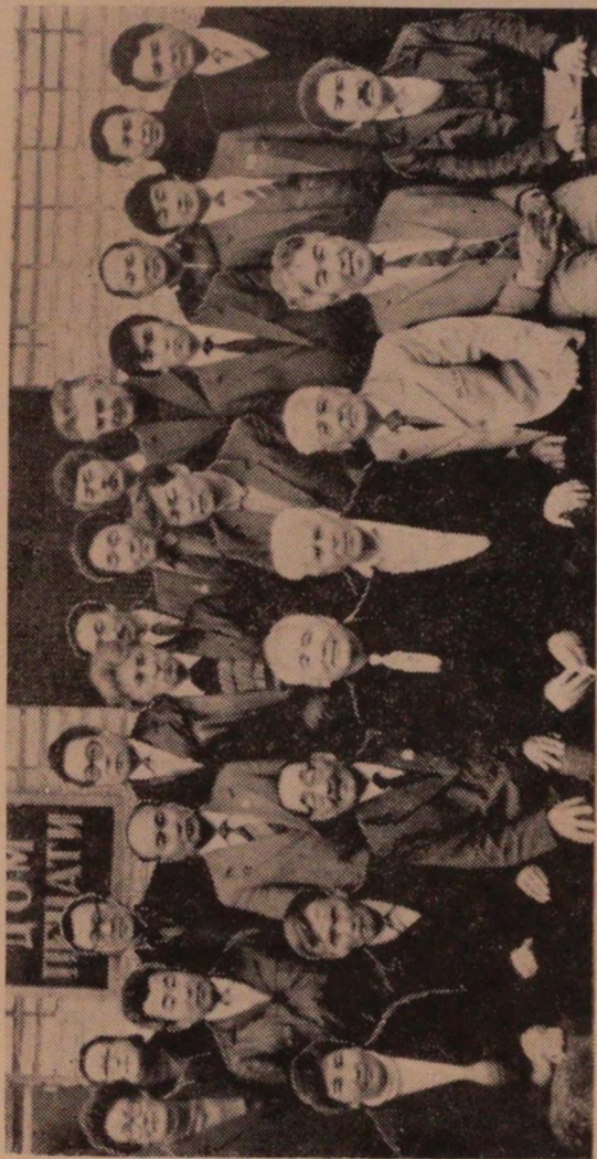
Туулу Алтайдын бичирилик организациязынын отчет-выборлу жуунынын туружаачылары. 1985 жыл, 11 сентябрь